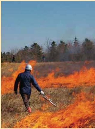
植生管理の目的で毎年冬に行う“火入れ”の様子